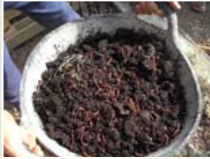
Arqueta de compost con lombrices. Abajo: lombrices rojas.

es de reducir la cantidad de agua que requiere más tratamiento y así el sistema será menor y más sencillo.