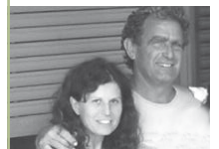
Escrito por: INÉS SÁNCHEZ y RICHARD WADE

Hay que decir que en este caso, los propietarios decidieron por razones constructivas y personales,